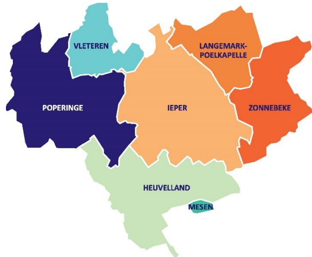
Werkingsgebied CO 7

Sinds 2016 is CO 7 erkend als intergemeentelijke onroerend erfgoeddienst (IOED). De werking van de dienst ging van start vanaf 2017 en omvat archeologie, monumenten en landschappen. De werking rond landschappelijk erfgoed gebeurt in nauwe samenwerking met het Regionaal Landschap Westhoek .