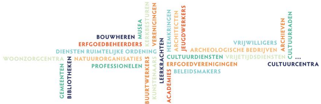
Partners van CO 7