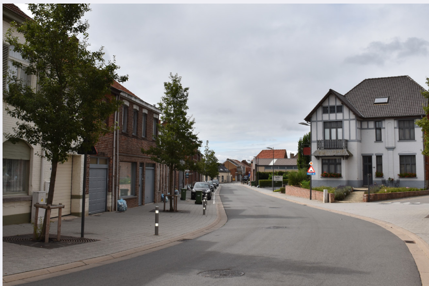
Mesen Armentiersstraat, anno 2019

Niet al het bouwkundig erfgoed in de Zuidelijke Westhoek staat op de Inventaris. Veel gebouwen hebben een lokale waarde en karakteriseren de dorpen en steden .