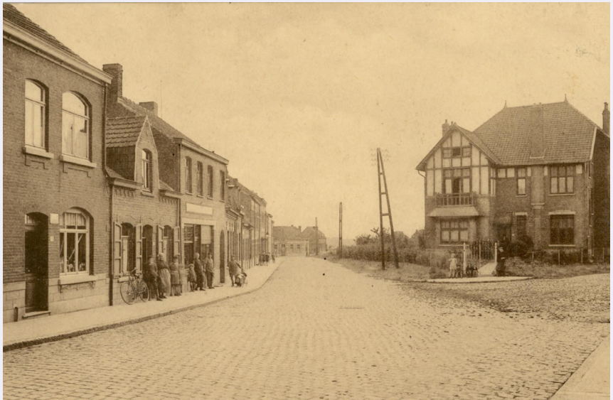
Mesen Armentiersstraat, anno 1945-1959