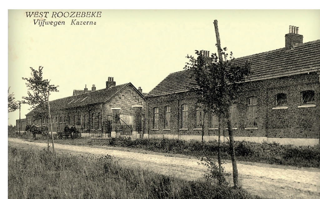
Vooraanzicht van de kazerne van Westrozebeke

Een aantal straatnamen verwijzen nog naar het militaire verleden van deze plaats, denk maar aan de Kampstraat (zie 3 op de kaart) en de Ontmijnersstraat (zie 4 op de kaart).