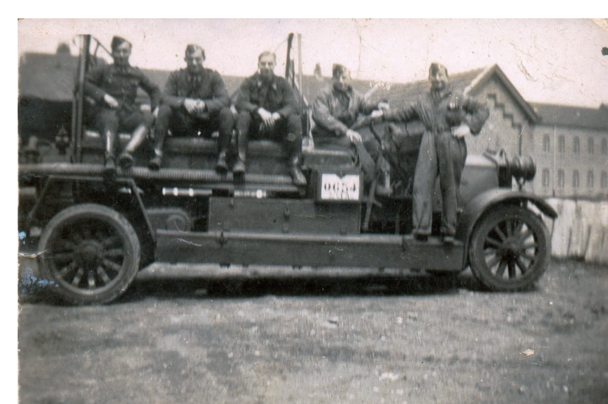
Circa 1936: enkele legermakers poseren op een brandweerwagen tijdens hun legerdienst in de kazerne van Westrozebeke

Het terrein van de kazerne van Westrozebeke is 2 hectare groot. Rondom een rechthoekig gekasseid plein werden verschillende gebouwen opgericht, gebouwd in de typische wederopbouwstijl, een stijl die overal tijdens het herstel van de Westhoek na WO-I gebruikt is. Het zijn lange gebouwen in rode baksteen, met de strakke ritmiek van ramen en mooi versierde zijgevels.