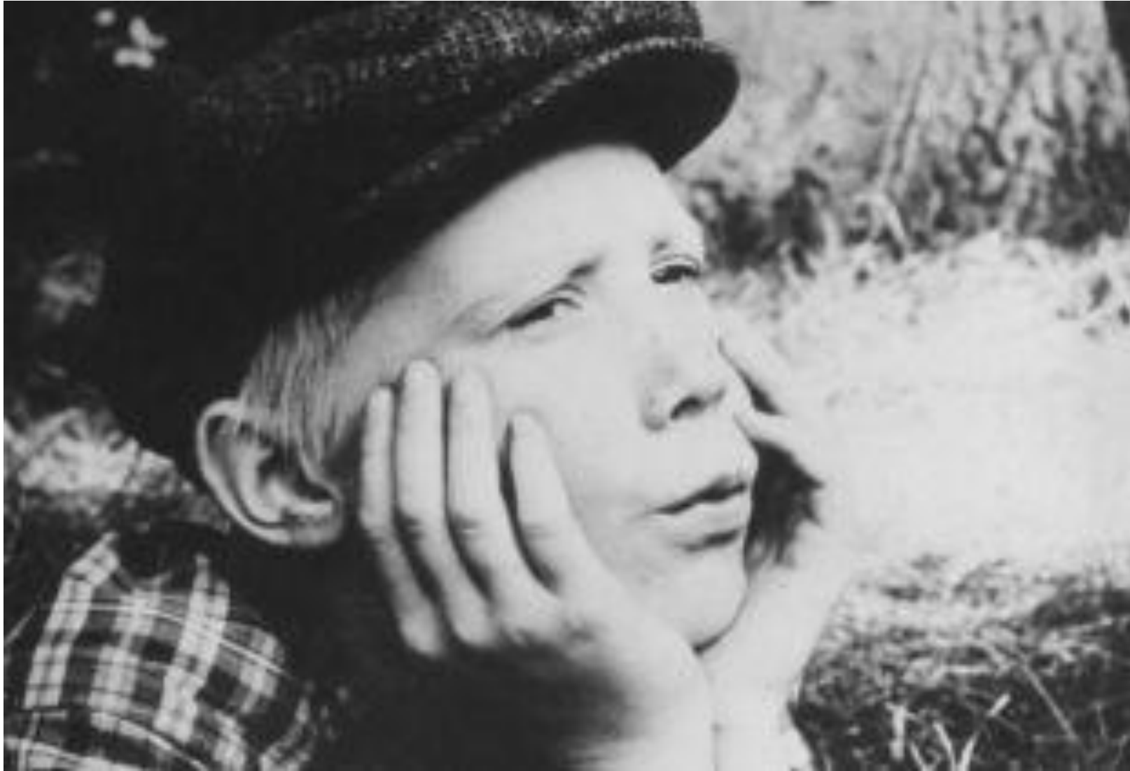
Wij, Heren van Zichem