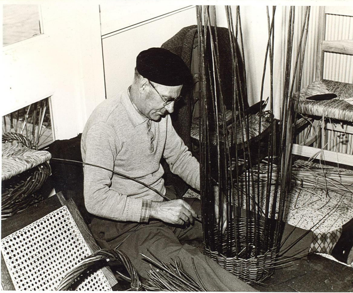
Mandenvlechter uit Zonnebeke. Privécollectie, 'WESTHOEK verbeeldt'