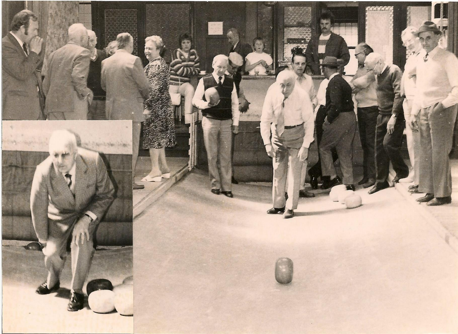
Bolders uit Watou. Privécollectie, 'WESTHOEK verbeeldt'