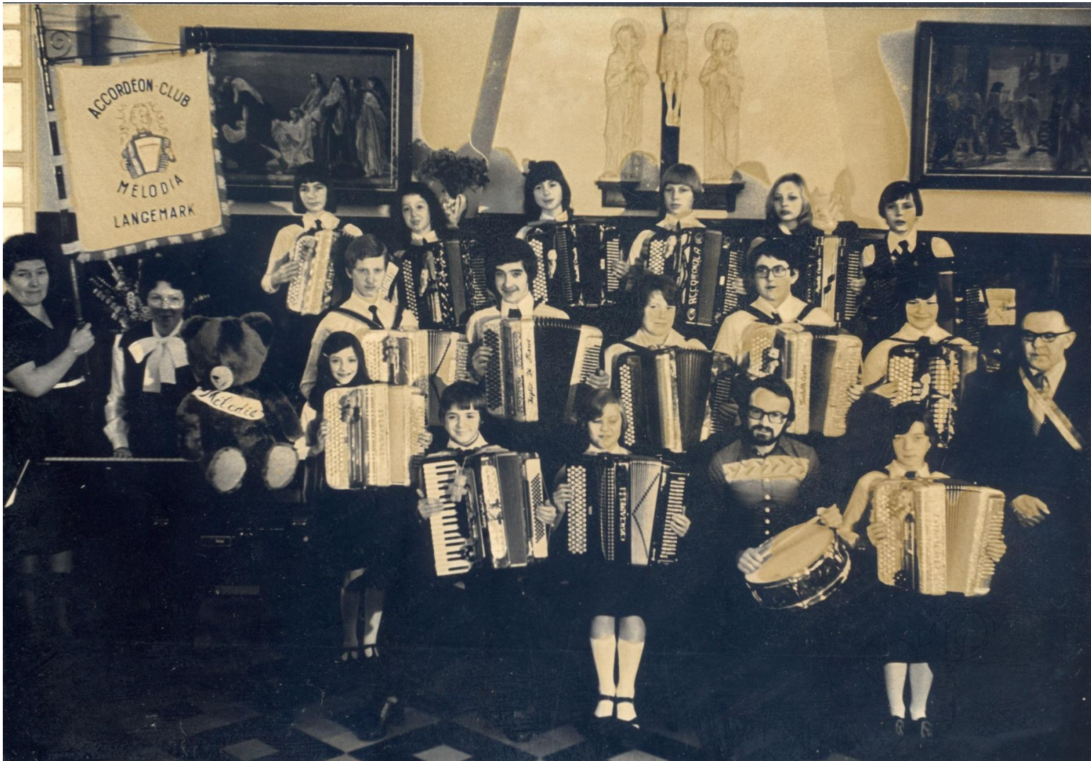
Accordeonclub Melodia uit Langemark. Privécollectie, 'WESTHOEK verbeeldt'