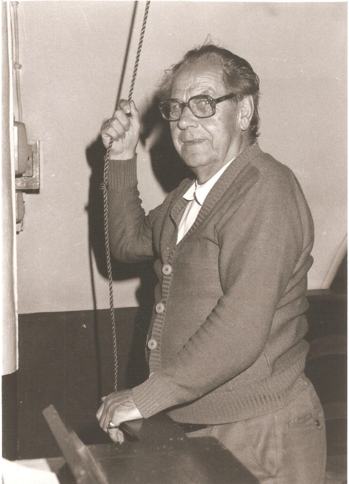
Klokkenluider uit Adinkerke.