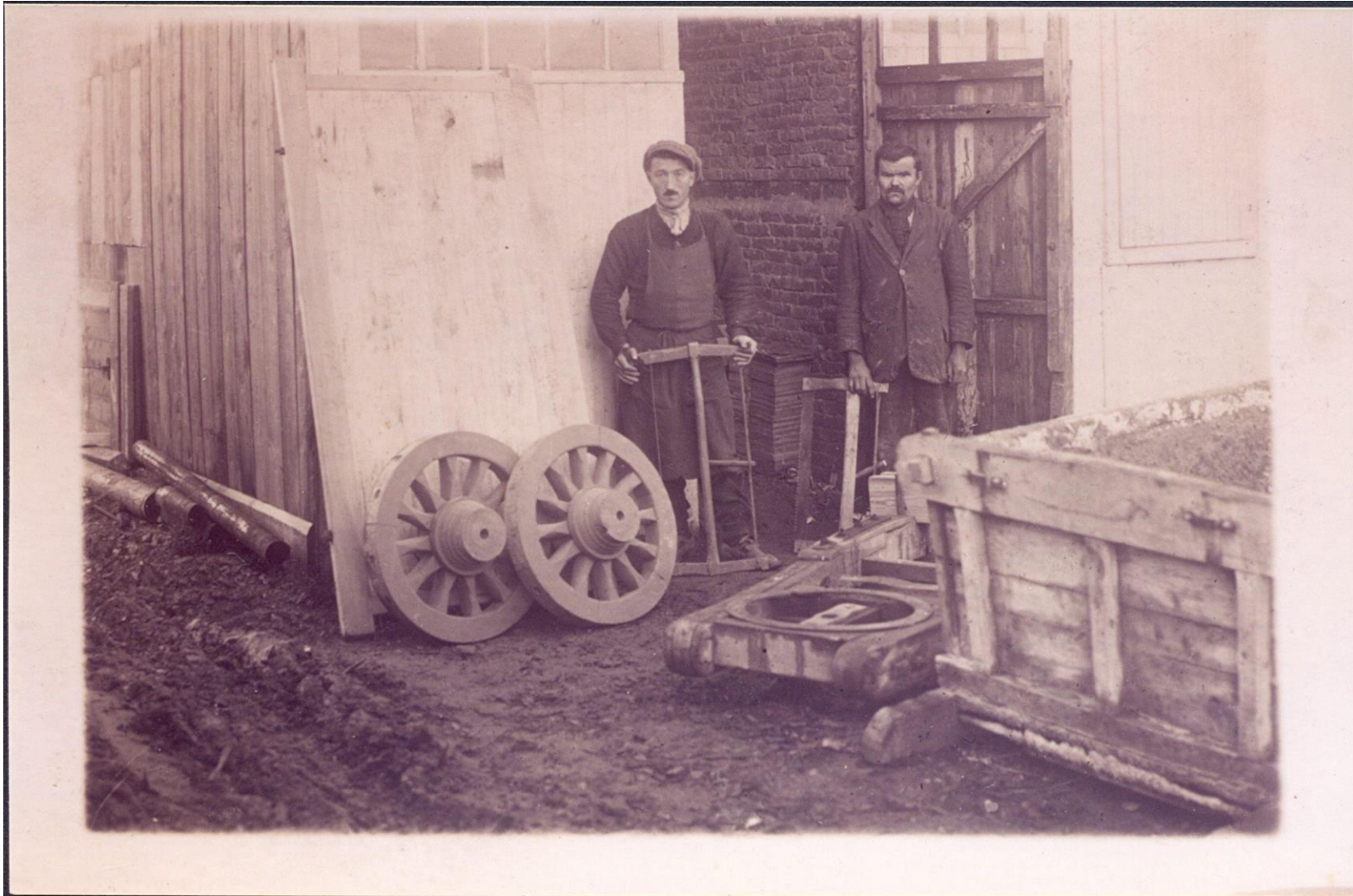
Wagenmakers uit Brielen. Privécollectie, 'WESTHOEK verbeeldt'