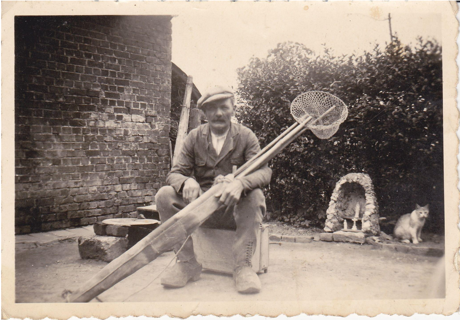
Hobbyvisser uit Adinkerke.