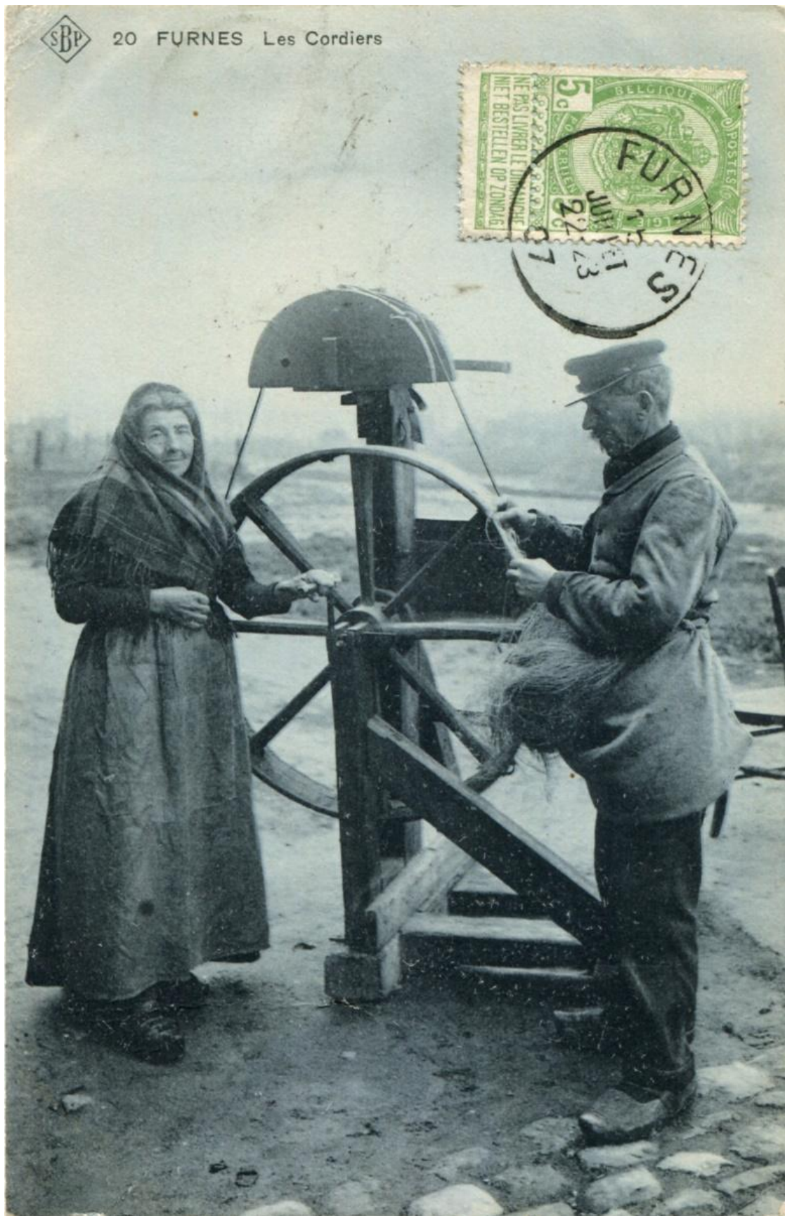
Touwslagers uit Veurne.