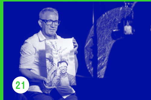
← © k.ERF