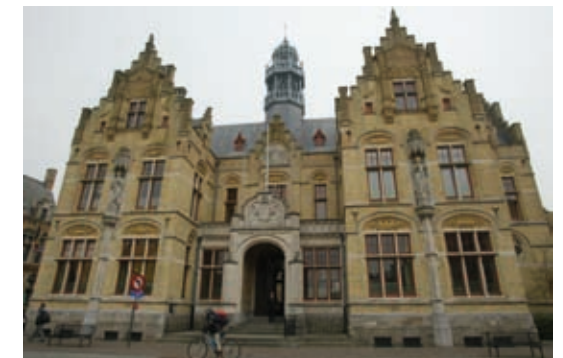
↑ Gerechtsgebouw, Ieper