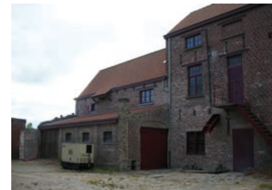
↑ Site voormalige brouwerij Sint-Joris + brouwershuis, Reningelst

organisatie: Dienst Cultuur · Grote Markt 1 · 8970 Poperinge · T 057 34 66 86 · E cultuur@poperinge.be