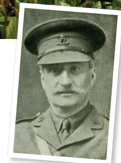
↑ Graf van Majoor William H.K. Redmond, Loker