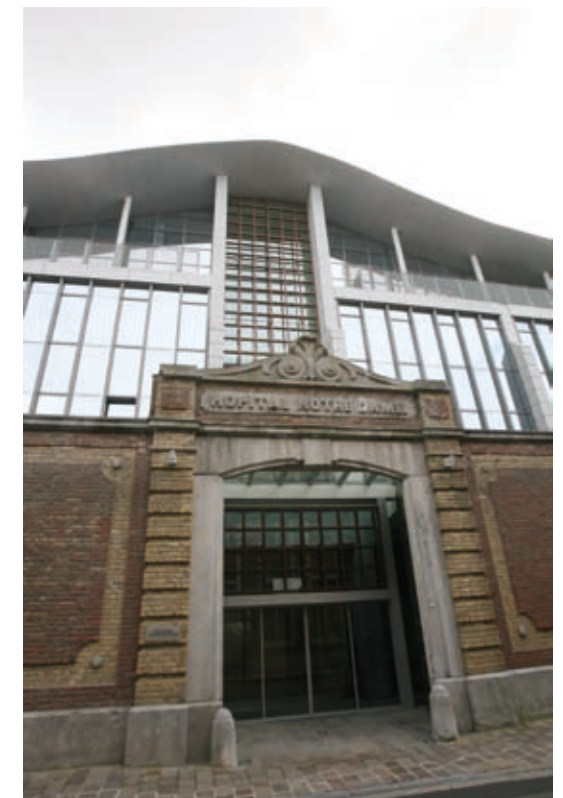
↑ Nieuwe vleugel gerechtsgebouw, Ieper