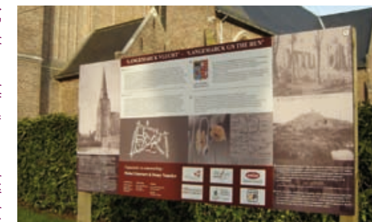
↑ Beeldenwandeling 'Langemarck Vlucht'