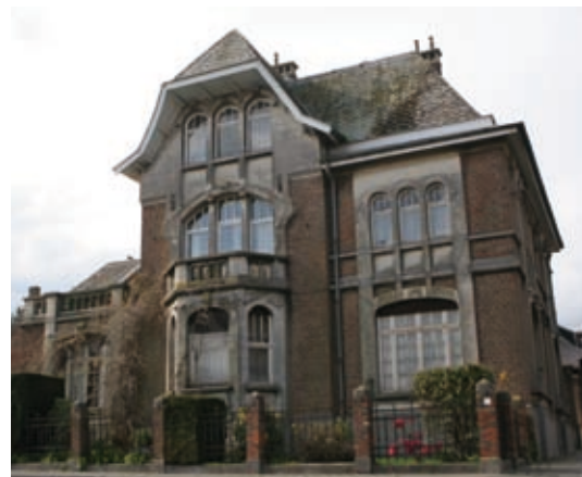
↑ Wederopbouwarchitectuur, Beselare