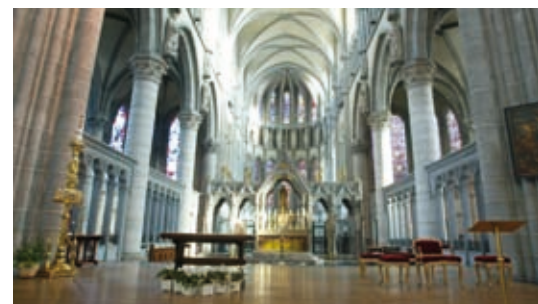
↑ Sint-Maartenskerk, Ieper

De blikvanger van deze Open Monumentendag is echter het monumentale doek "Het Beleg van Ieper uit 1667". Dit schilderij, dat 2 op 5 meter meet, onderging onlangs een twee jaar durende en broodnodige restauratie. Het verhaalt hoe op 8 augustus 1383 (Thuyndag) het beleg van Ieper door Gentenaars en Engelsen werd opgegeven. Volgens de dankbare Ieperlingen was dit te danken aan Onze Lieve Vrouw.