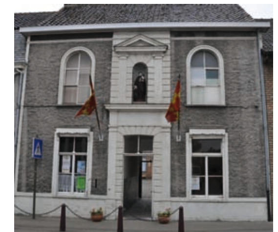
↑ Het oude schoolgebouw, Oostvleteren