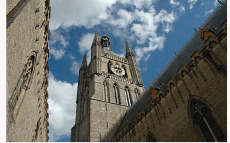
↑ Het belfort van Ieper is 70 meter hoog.

En Willem van Ieper, burggraaf van Lo? Hij had bewezen met wapens en