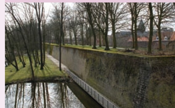
↑ De vestingen van Ieper, gebouwd naar een ontwerp van Vauban, nodigen uit tot een wandeling.