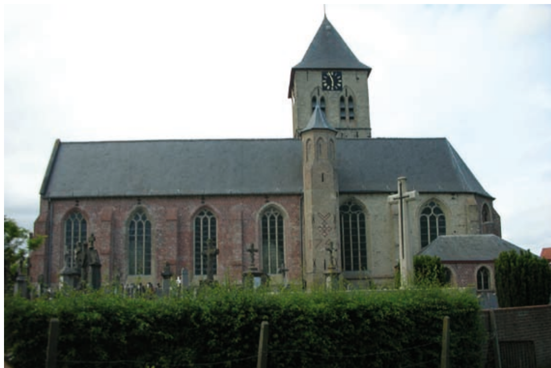
↑ Sint-Vedastuskerk, Reningelst