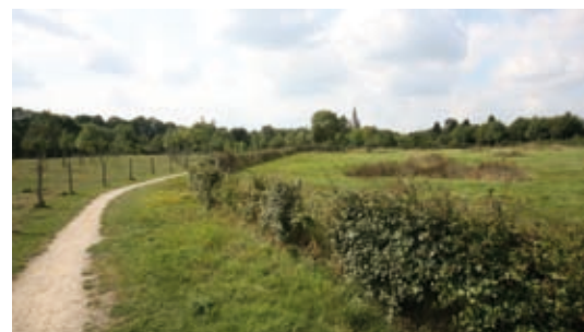
↑ Hoornwerkpark, Ieper

Tijdens dit bezoek herontdek je dit gebied met veel aandacht voor de militaire inrichting ervan in de 17 de tot de 19 de eeuw, en de evoluties die het doormaakte tot op vandaag. Een bezoek aan de ondergrondse, normaal ontoegankelijke kazematten, is een unieke ervaring!