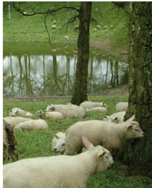
↑ De Palingbeek, Zillebeke

In dit unieke natuurdomein was en is een conflict nooit veraf. Tijdens de Eerste Wereldoorlog werd Ieper langs drie zijden belegerd. Dit front werd berucht als de 'Ypres Sallient' of de 'Ieperboog'. Domein De Palingbeek en omgeving werden in één groot slagveld herschapen. Duizenden soldaten lieten hier het leven. Het imposante Kasteel De Palingbeek verdween ook toen zo goed als van de kaart. Sommige sporen verdwenen, maar het landschap bewaart nog diepe littekens. Bunkers en begraafplaatsen blijven aan het oorlogsgeweld herinneren. De natuur herstelde wat de mens vernielde en maakte van de Palingbeek een boeiend stukje natuur.