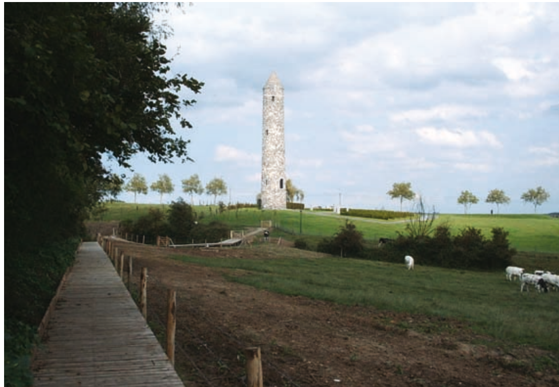
↑ Vredespark en -toren, Mese