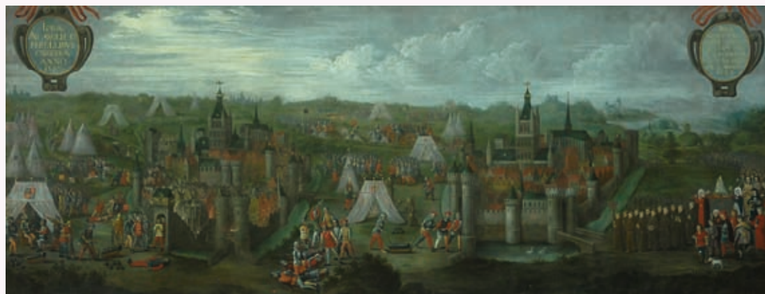
↑ Schilderij 'Het Beleg van Ieper (1383)' in de Sint-Maartenskerk

Welke wapens ze gebruikten, hoe de belegeraars te werk gingen, het belfort, de lakenhalle en de vestingen: alles staat erop. Uiterst rechts zien we een processie met de franciscaner monniken voorop. In het midden het beeld van Onze-Lieve-Vrouw met aan haar voeten een afsluiting: Onze-Lieve-Vrouw-van-Thuyne, patroonheilige van Ieper. Het volk biddend daarachteraan. Waarom? Het schilderij is het relaas van de belegering van Ieper door de Engelsen samen met de Gentenaars. Een conflict tussen de Fransge-