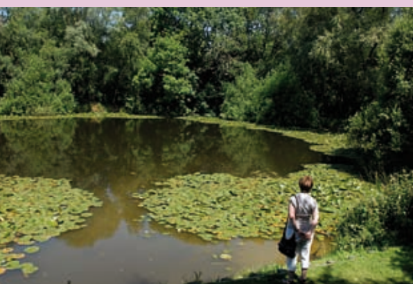
↑ De vredige 'Pool of Peace' is eigenlijk een mijnenkrater van de Mijnenlag van 7 juni 1917.

In september 1568 vatte men de bende nabij Kaaster. Alle leden werden op de markt van leper terechtgesteld. De kastijdingen waren verschrikkelijk voor Jan Camerlynck, de bendeleider. Eerst werden zijn oren afgesneden, daarop werd hij met een gloeiende tang genepen en vervolgens gezeseld. Gebonden achter een kar werd hij rond de markt gesleurd om uiteindelijk op het schavot te worden vastgebonden met een brandende ton pek boven zijn hoofd zodat hij levend verbrandde. Als voorbeeld kon dat dienen!