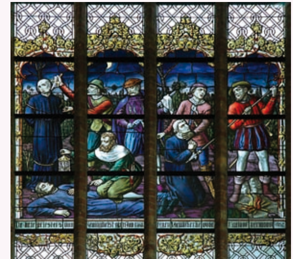
↑ Ook in de kerk van Dranouter getuigen een wandtapijt en een brandglasraam (foto) over het lot van de drie geestelijken.

en op wraak belust. In dezelfde kerk een relikwie met stukjes beenderen van de drie geestelijken en hun namen. Welke gebeurtenissen nemen een aanvang bij het brandglasraam om bij het relikwie te eindigen?