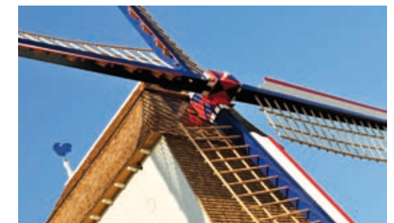
↑ Beeuwsaertmolen, Bikschote