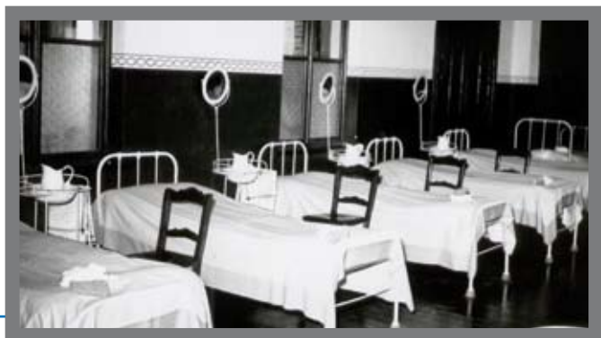
Slaapzaal (jaren '30)

Zeven zusters en twee als onderwijzeres gediplomeerde religieuzen maakten er de dienst uit.