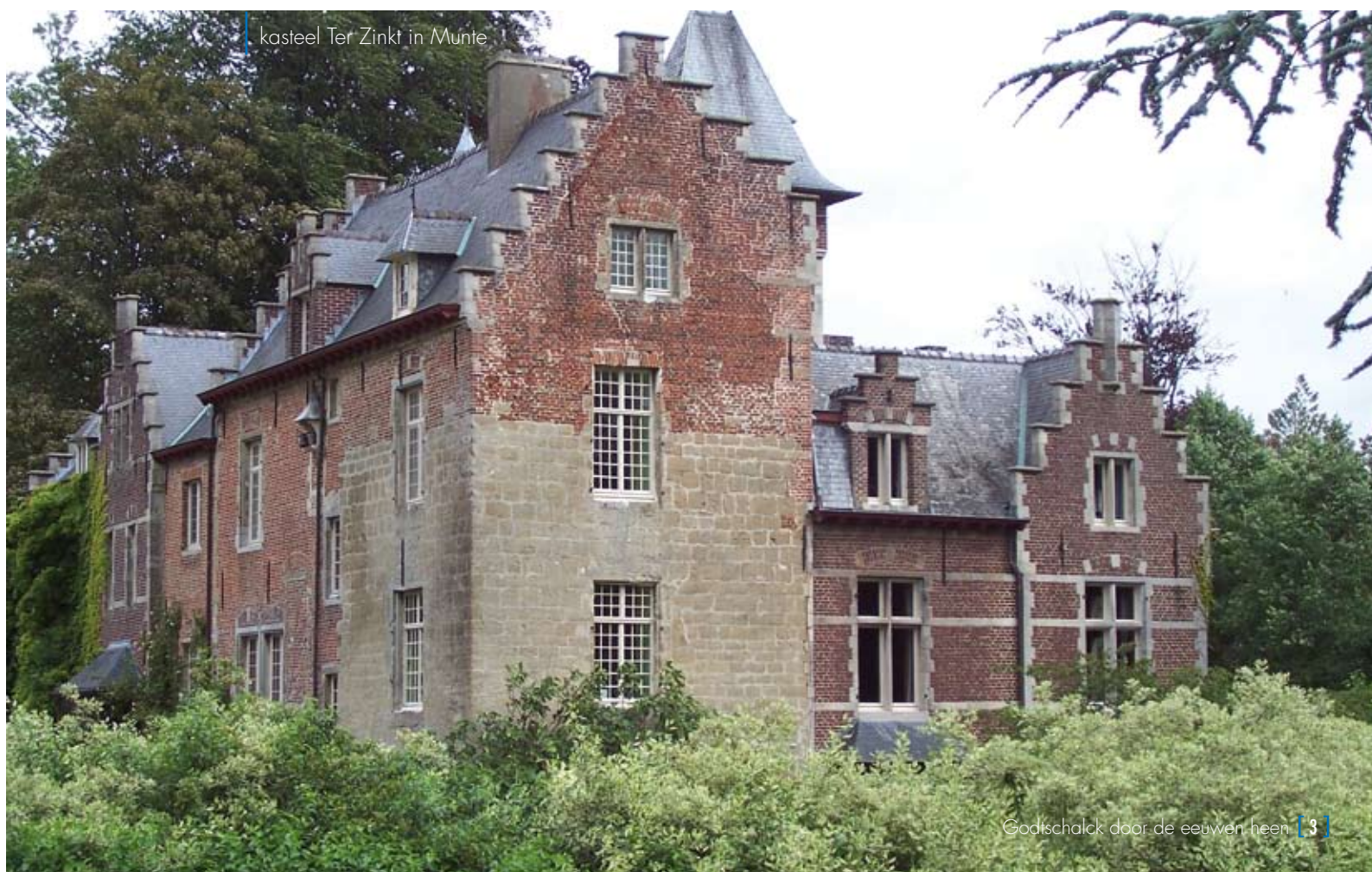
kasteel Ter Zinkt in Munte

Het testament stelde dat de opbrengst van de onroerende goederen moest gebruikt worden voor de oprichting en het onderhoud van een centrum voor de opleiding van weeskinderen tot bekwame landarbeiders op zijn eigendom in Wijtschate. Indien er nog geld overbleef, moest ook een gesticht voor meisjes worden opgericht.