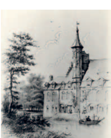
Tekening van het kasteel van Kemmel van Auguste Böhm, vermoedelijk ca. 1850 (kopie) Collectie Hotel-Museum Arthur Merghelynck

Allemaal zijn we erfgenamen van onschatbare rijkdommen die anderen voor ons hebben nagelaten. En het mooiste is niet dat er dagelijks erfgoed bijkomt, maar wel dat de waarde van die erfenis alleen maar groter wordt als je ze deelt met anderen. Stippel je eigen parcours uit en maak Erfgoeddag mee! Alle activiteiten zijn gratis.