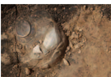
Romeinse jachtbeker gevonden in de Zwiinlandstraat in Poperinge