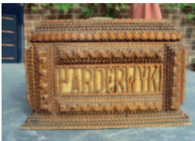
Naaktoffertje dat Achiel Odent maakte tijdens zijn internering in Harderwijk tijdens WO1.