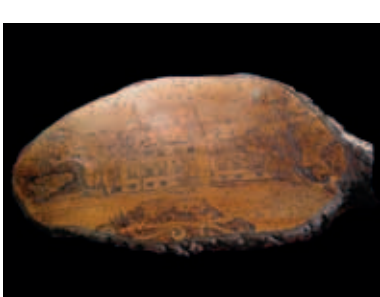
Een Duits soldaat maakte deze houtbewerking tijdens de Eerste Wereldoorlog van het toenmalige kasteel van Langemark.