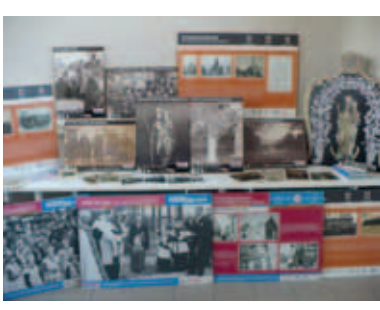
Een deel van de erfenis die in de straten van Abele te zien zal zijn.