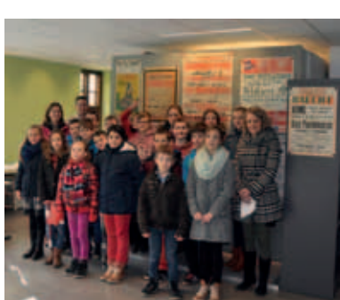
De kinderen van het 5 de en 6 de leerjaar van Klavertje 3 brengen een bezoek aan het gemeentearchief.

Locatie OC De Scure, Veurnestraat 4, 8640 Oostvleteren Tijdstip 10u-18u Meet & greet met notaris om 10u30