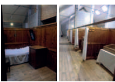
Chambrettes in 't Pensionaat