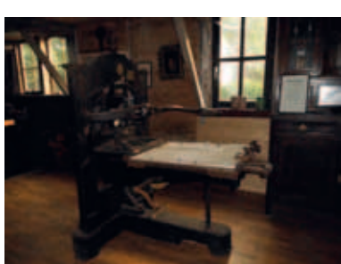
Oude handdrukkers van omstreeks 1830

Locatie Dranouterstraat 34, 8950 Nieuwerkerke Tijdstip Demonstraties om 10u30, 13u30, 14u30, 15u30, 16u30 en 17u30