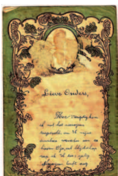
Nieuwjaarsbrief van Germaine Vanwildemersch uit Poelkapelle, 1 januari 1931 Privécollectie, 'WESTHOEK verbeeldt'