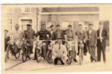
Bromfietsstreffen in Voormezele, vermoedelijk in 1958.