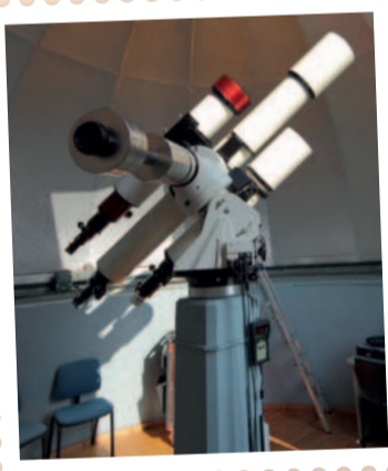
Telescopen in AstroLAB IRIS