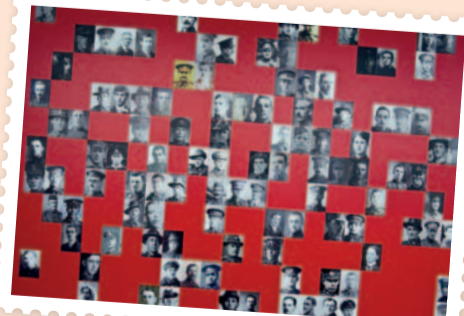
Op Lijssenthoek liggen bijna 11.000 oorlogsslachtoffers begraven.