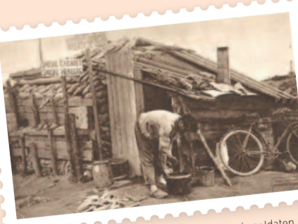
Smiske herberg, een plaatsje van vertier voor de soldaten