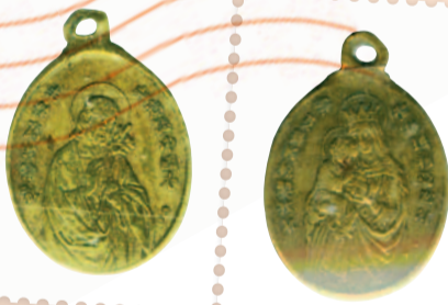
De Chinese Sint-Jozefspenning Collectie Onzen Heertje erfgoedvereniging