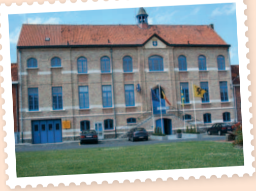
Cultuurhuis Mesen vóór de renovatie.