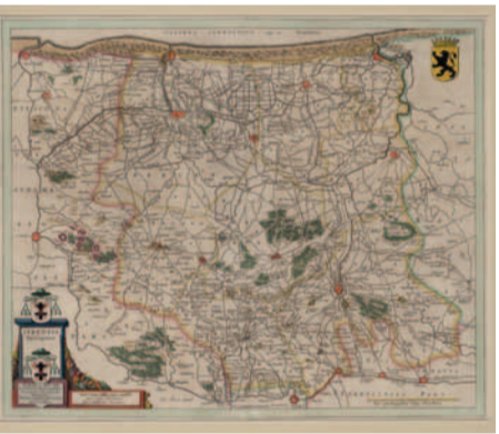
Hollebeke lag niet in het bisdom Ieper, maar in het bisdom Doornik.