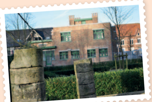
Kenniscentrum Passchendaele 1917