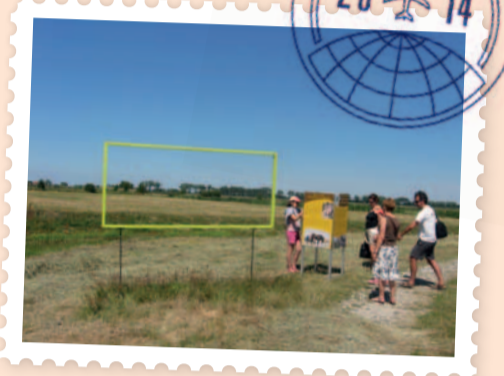
Speciale plekjes worden letterlijk ingekaderd.