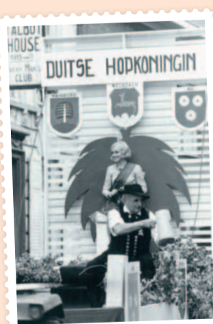
Duitse hopkoningin