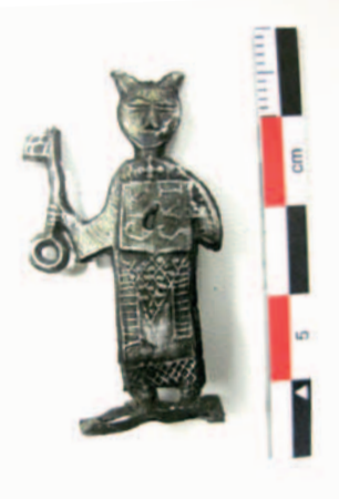
Antropomorf kat uit de 13 e eeuw, opgegraven in de Lombaardstraat te Ieper.