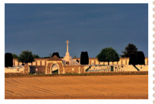
Tyne Cot Cemetery