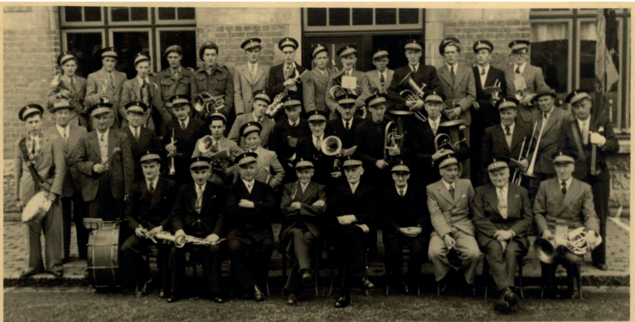
DE EEUWFEESTVIERING VAN DE MUZIEKMAATSCHAPPIJ. "DE KONINKLIJKE FANFARE " TE MESEN - 18/5/50.

De Koninklijke Fanfare van Mesen vierde op 18 mei 1950, omwille van de oorlog, met tien jaar vertraging haar eeuwfeest.