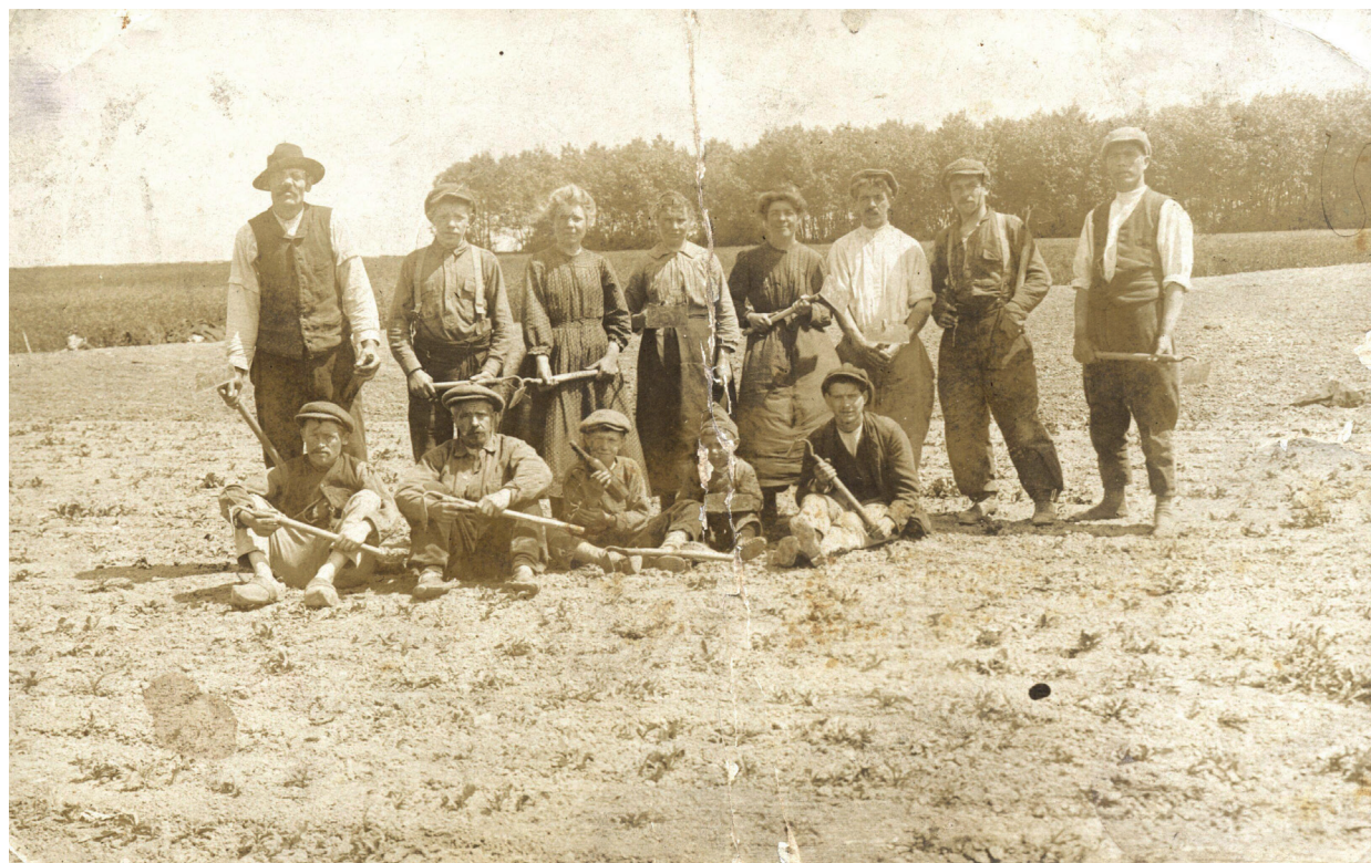
Seizoenarbeiders uit de Madonna poseren voor de foto in Noord-Frankrijk, 1920.