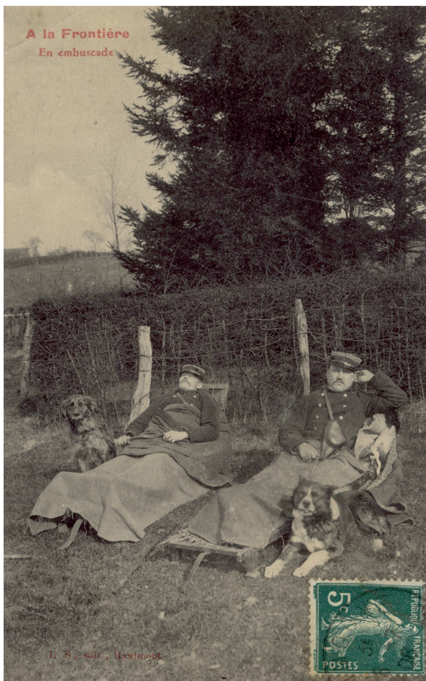
Fransen douaniers liggen langs de grens vergezeld van hun waakhonden om mogelijke smokkelaars op heterdaad te betrappen, 1900-1914.