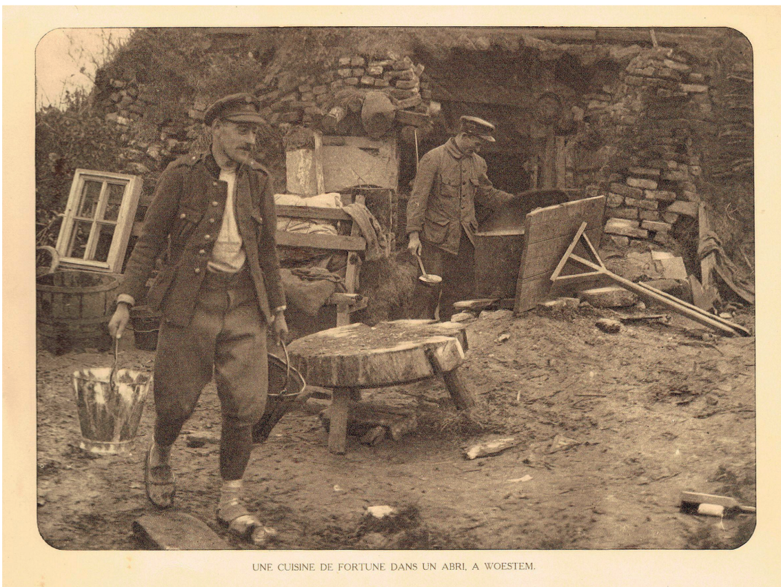
UNE CUISINE DE FORTUNE DANS UN ABRI, A WOESTEM.

Twee soldaten voor hun schuilplaats en keuken tijdens de Eerste Wereldoorlog te Woesten. In de zomer van 1915 sloten Algerijnse soldaten als versterking aan bij de Franse soldaten. Privécollectie, 'WESTHOEK verbeeldt'