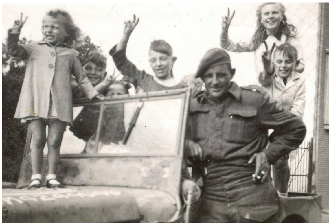
Watouse kinderen maken het V-teken op de jeep van een Engelse sergeant tijdens de bevrijdingsdagen van september 1944.