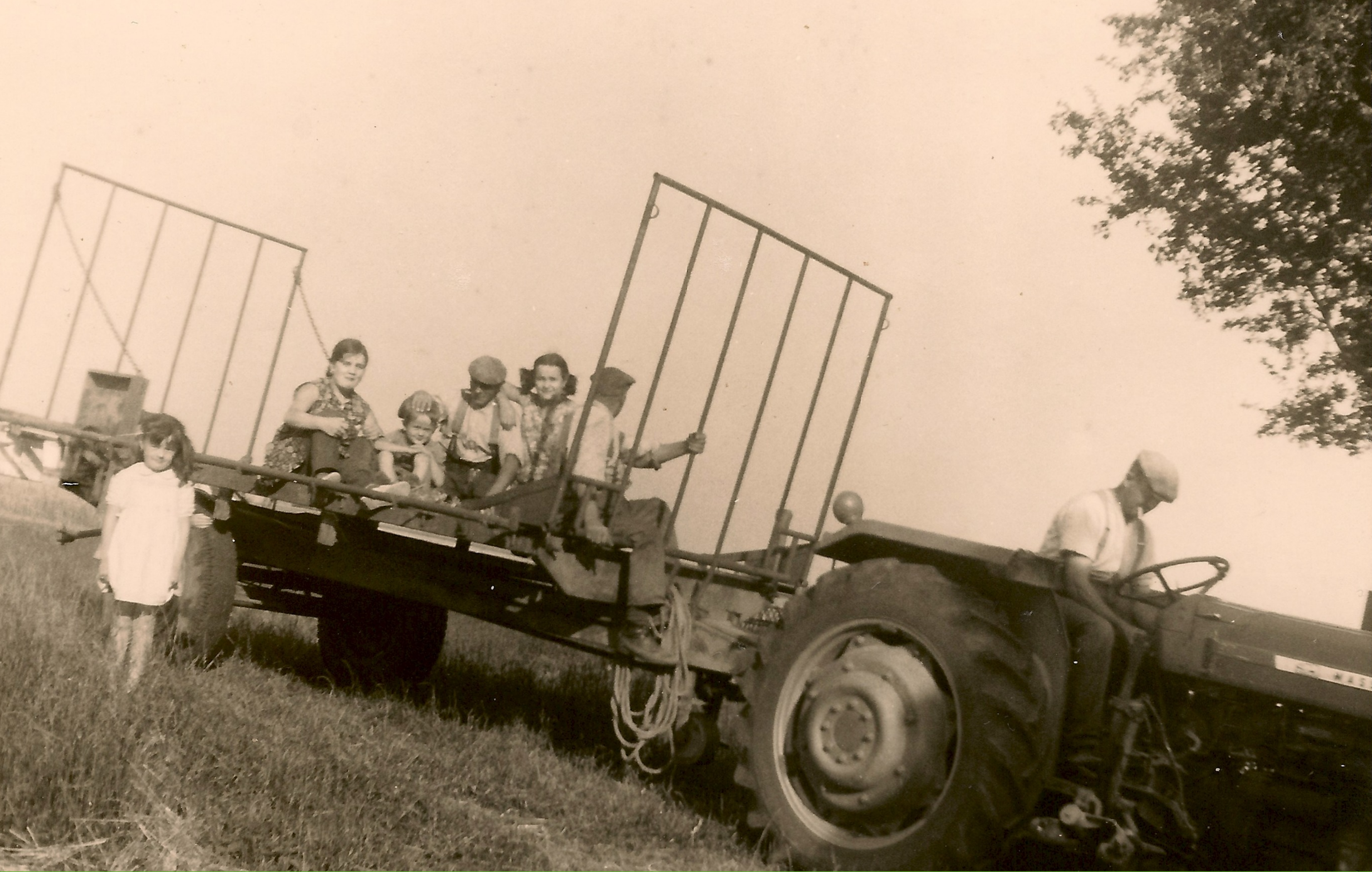
Sint-Jan-Ter-Biezen: Oogsttijd - 1969