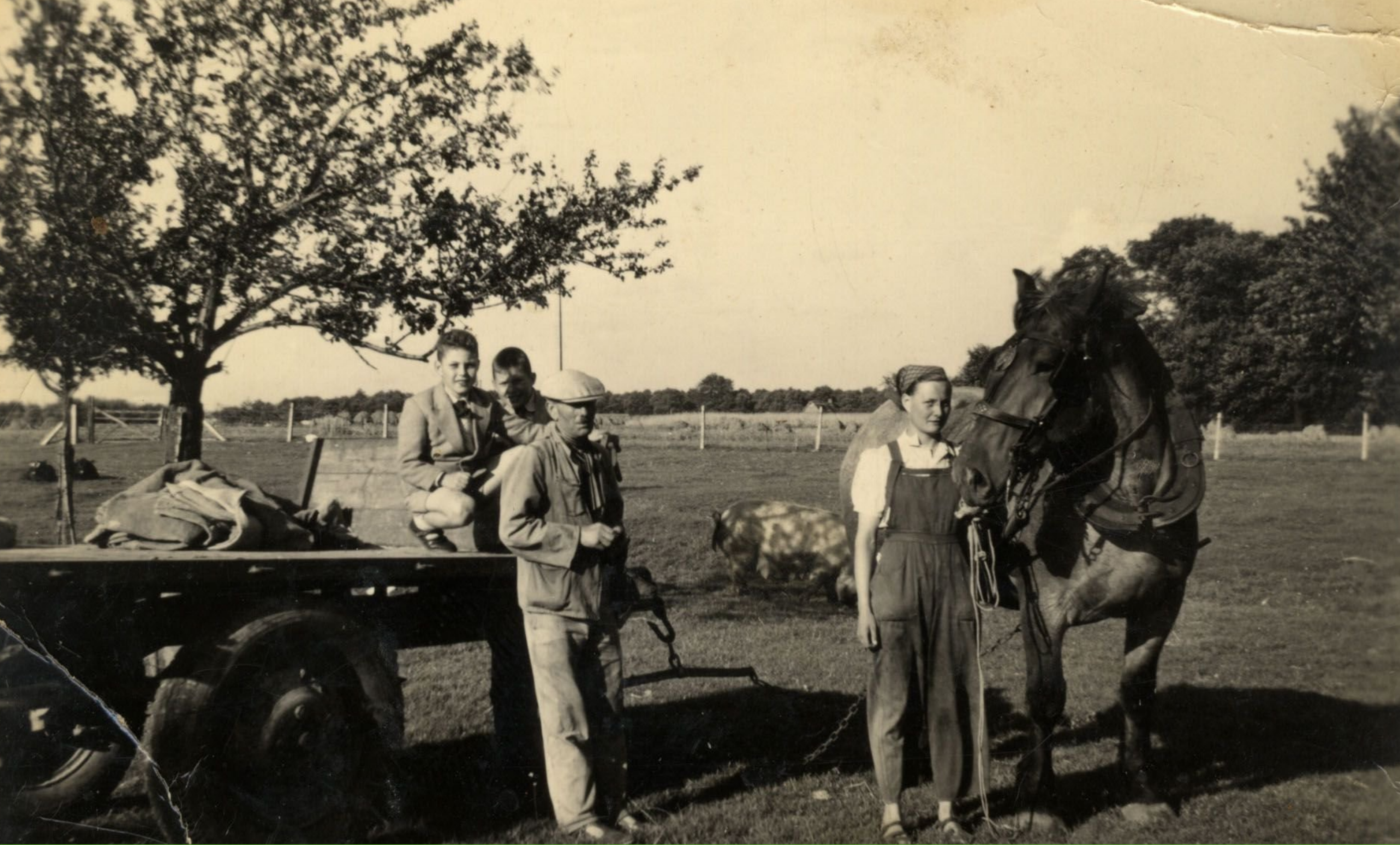
Krombeke: Hoeve Hahn