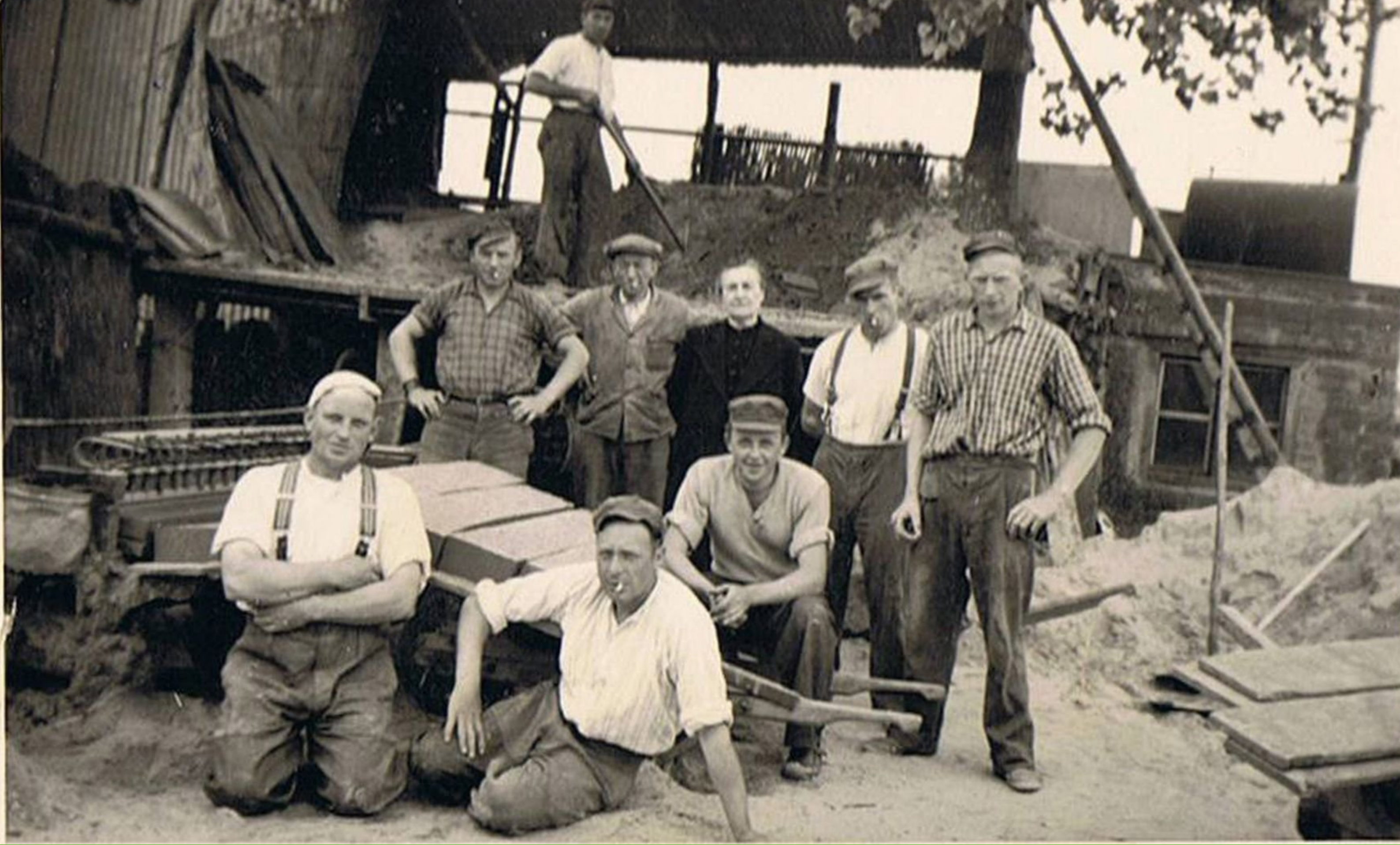
Proven: Steenbakkerij 1945 - 1959